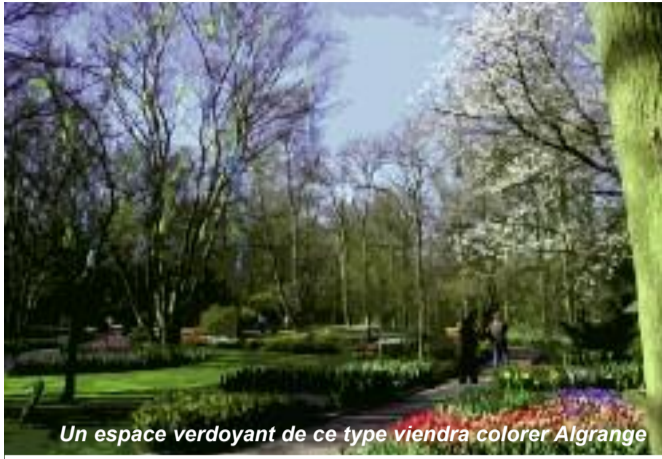
Un espace verdoyant de ce type viendra colorer Algrange

Les créations de parc, d'espaces jeux, d'espace "Trois raquettes", de boulodrome couvert, promesses de campagne électorale font l'objet d'étude approfondie. Ces projets de développement urbain résultent d'une forte demande de nos administrés. S'agissant du boulodrome, nous avons recensé un minimum de 596 Algrangeois s'adonnant à cette pratique