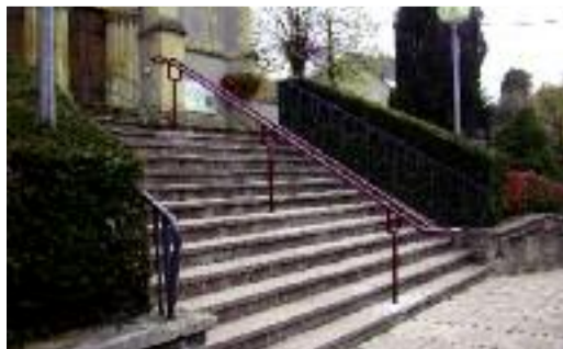
Plusieurs travaux de ferronnerie comme cette rampe mise en place sur les escaliers de l'église ont été réalisés