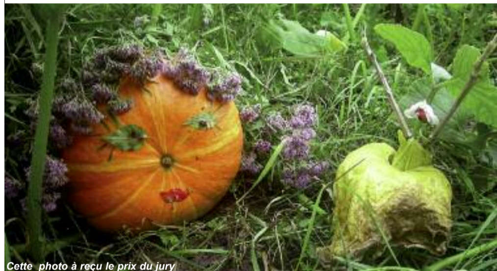
Cette photo a reçu le prix du jury

plaisir de tous tout au long du festival. Le jury a par ailleurs eu beaucoup de mal à trancher pour désigner le palmarès de chacune des trois catégories. Si les lauréats se sont vus attribuer des bons d'achats, aucun candidat n'est reparti les mains vides, car leur participation méritait d'être à elle seule récompensée et l'a été avec plaisir.