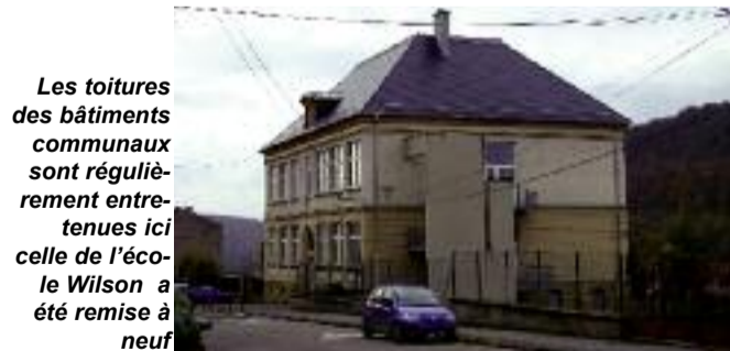
Les toitures des bâtiments communaux sont régulièrement entretenues ici celle de l'école Wilson a été remise à neuf

Enfin des travaux d'entretien comme les réparations des portes de garages place du marché et du centre de secours, ou le remplacement des portes du foyer socioculturel et de l'Etincelle, sont quotidiennement réalisés dans la commune.