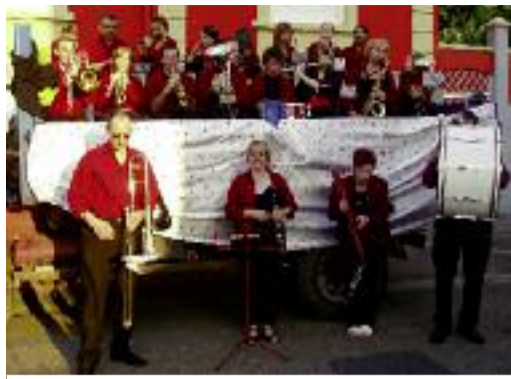
Le camion rougeoyant affrété par "Musicalis" a sillonné les rues de la ville

Puis six jours durant, partout en ville se sont succédés : des