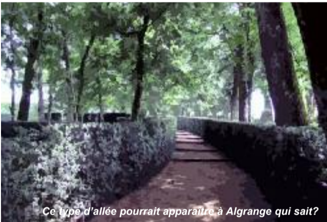
Ce type d'allée pourrait apparaître à Algrange qui sait?

L'avancée de ces dossiers vous sera communiquée dans un prochain bulletin municipal.