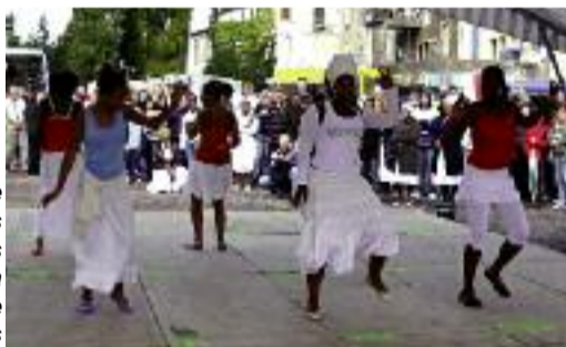
Arrivant de Fameck les Cap-verdiens ont animé la fête comme jamais

Si les estomacs et les palais étaient gâtés, les yeux et les oreilles n'étaient pas en reste entre les démonstrations de danses et de musiques venues du monde entier et, le show de l'association "Equidestra" qui a présenté plusieurs tableaux des plus audacieux.