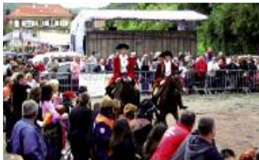
"Equidestra" a enchanté le public, les cavaliers et cavalières en tenues ont animé la fête et fait le spectacle

7 septembre dernier place François Mitterrand. Pourtant pour les organisateurs, le découragement n'était pas de mise au regard du travail accompli. C'est, sans doute, ce qu'a dû se dire le soleil car, avec la nonchalance dont il sait faire preuve à l'approche de l'automne, il a décidé de pointer quelques rayons vers Algrange.