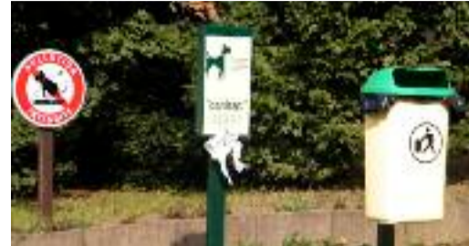
Un panneau en guise de piqûre de rappel, un distributeur de «Canisacs» et une poubelle à disposition de la population.

le bruit et les nuisances sonores, le stationnement des poubelles sur les trottoirs, la déambulation des animaux domestiques et leurs déjections existent et seront, compte tenu des efforts consentis, strictement appliqués.