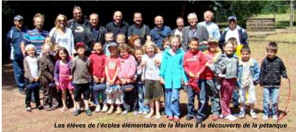
Les élèves de l'école élémentaire de la Mairie à la découverte de la pétanque