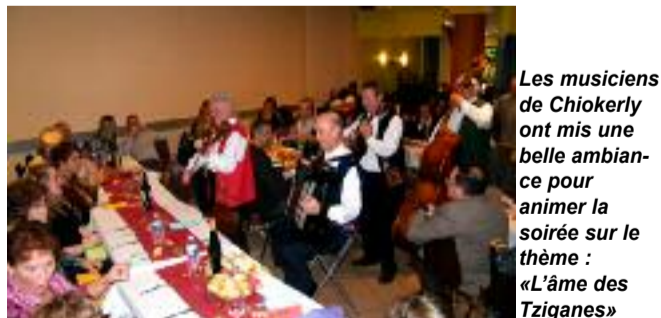
Les musiciens de Chiokerly ont mis une belle ambiance pour animer la soirée sur le thème : «L'âme des Tziganes»

Attention ! De 5 à 25 infractions par contrôle de vitesse. De 9h et 22h, quelque soit l'endroit, les services de la police nationale effectuent des contrôles inopinés dans les rues de notre cité..