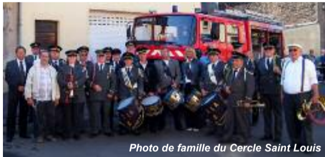
Photo de famille du Cercle Saint Louis

Avec plus de cinquante associations et clubs, la richesse du tissu associatif algrangeois est incontestable. Si la qualité n'attend pas le nombre des années nous sommes quand même fiers de fêter les anniversaires de nos partenaires associatifs ô combien importants et nécessaires à la vie d'une commune, surtout quand ils célèbrent un siècle d'existence comme le Cercle Saint Louis.