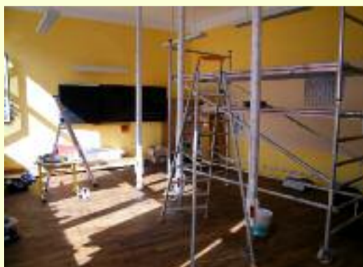
La nouvelle salle informatique de l'école élémentaire Wilson en plein travaux.

Ainsi à Algrange 7 bâtiments, 4 pour les écoles maternelles et 3 pour les élémentaires sont ouverts aux enfants de la ville. Chaque année la municipalité consacre un budget conséquent à la rénovation des locaux en question et de leurs abords. Cette année dans le cadre de la fusion des écoles rue Wilson ont été créés : une nouvelle salle de classe, une nouvelle salle informatique et une passerelle entre les deux écoles. De plus les couloirs de l'école élémentaire ont été rénovés.