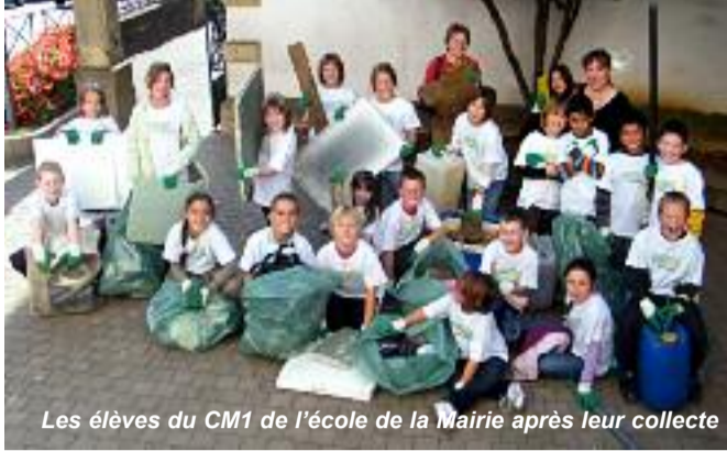
Les élèves du CM1 de l'école de la Mairie après leur collecte

Au cours de la première semaine de septembre les 115 enfants de l'école de la Mairie se sont mobilisés pour préserver notre environnement dans le cadre de l'action "Nettoyons la Nature". Parrainés par les centres E. Leclerc, qui leur ont fourni tee-shirt, gants et sacs poubelle, toutes les classes ont sillonné la ville et ses abords en quête de déchets défigurant