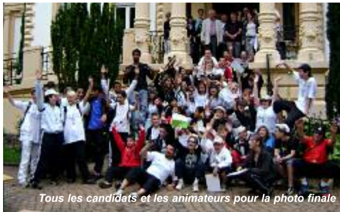
Tous les candidats et les animateurs pour la photo finale

Le parcours qui se voulait initiatique, à la découverte des richesses et trésors des trois communes organisatrices, était parsemé d'embûches, d'énigmes et de devinettes. Celles-ci ont permis aux concurrents de mieux appréhender l'histoire, le