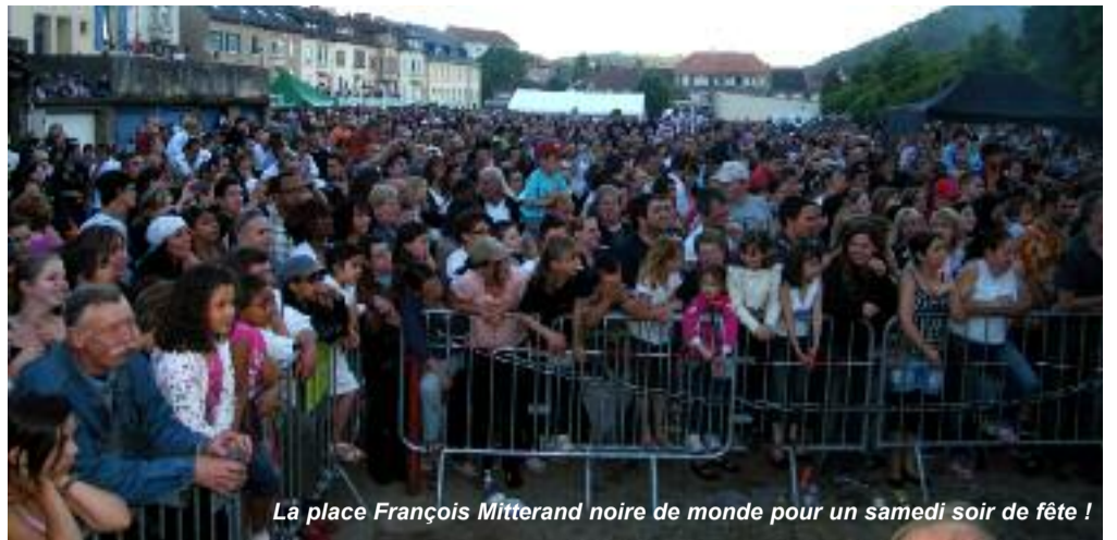
La place François Mitterrand noire de monde pour un samedi soir de fête !