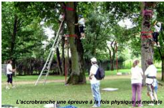
L'accrobranche une épreuve à la fois physique et mentale

Le rallye citoyen fut par ailleurs une belle collaboration entre les communes d'Algrange, Nilvange et Knutange. La réussite de cette manifestation tendant à prouver que la mise en commun de moyens et d'efforts permet de porter de beaux projets. L'expérience est bien entendu à renouveler.