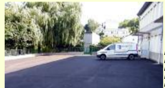
La cour de l'école élémentaire du Batzenhal rénovée.

Outre la mise à disposition de locaux et les investissements annuels, la commune entretient les établissements et couvre la totalité des dépenses de fonctionnement rattachées. Ainsi ce ne sont pas moins de 7 agents d'entretiens communaux qui assurent la propreté des trois écoles élémentaires et 8 ATSEM (Agents Territoriaux Spécialisés des Ecoles Maternelles) qui aident le corps enseignant dans nos maternelles et assurent leur nettoyage. Bien entendu à ces frais s'ajoutent les factures de chauffage, d'électricité et d'eau.