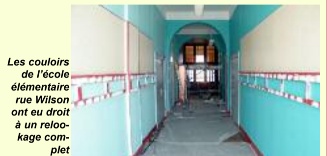
Les couloirs de l'école élémentaire rue Wilson ont eu droit à un relookage complet

Dans le même temps, le groupe scolaire du Batzenhal a fait lui aussi l'objet de travaux importants. En effet les deux cours d'écoles ont été refaits et les sols de deux salles de classe ont été remplacés. En 2010 ce sera l'école de la Mairie qui fera l'objet d'une rénovation importante.