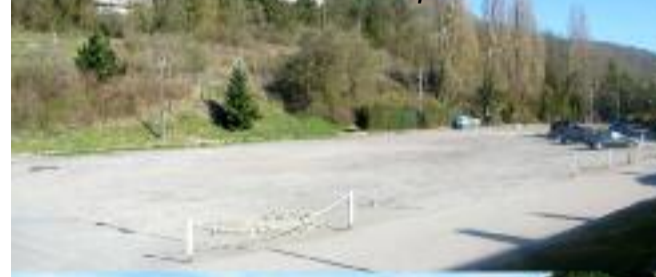
La place pendant les travaux