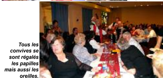
Tous les convives se sont régalez les papilles mais aussi les oreilles.