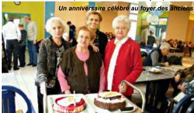
Un anniversaire célébré au foyer des anciens

comme l'an passé, une distribution de colis sera faite dès le 4 janvier pour les personnes de plus de 65 ans n'ayant pas pu venir à l'un des repas de Noël et des cours d'initiation à l'informatique et à l'outil multimédia devraient voir le jour pour 2010.