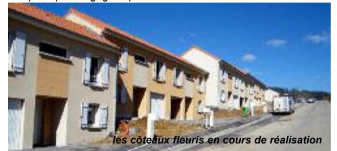
les coteaux fleuris en cours de réalisation