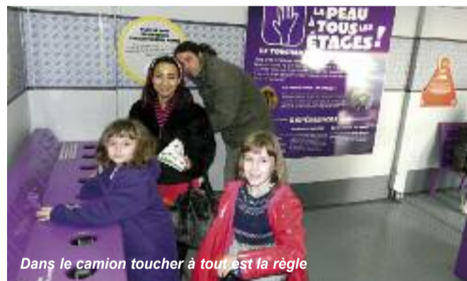
Dans le camion toucher à tout est la règle