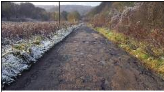
La route de la mine de Rochonvillers a fort heureusement bien changé. En effet sous l'impulsion de la municipalité, le Conseil Général a rénové le tronçon qui n'était pas sur le territoire de la ville. Le chemin peu carrossable est redevenu une rue qui est également une entrée de ville.