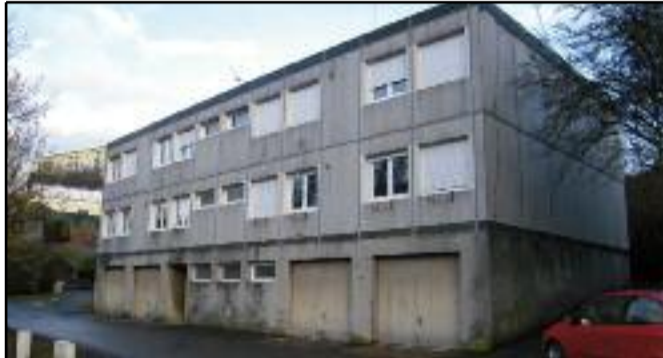
Le petit collectif à l'entrée de la rue des Coquelicots avait bien besoin d'une cure de jouvence. Celle-ci est enfin terminée comme en témoignent ces photos. Outre le confort des résidents et les économies d'énergie liées à une bonne isolation, l'entrée de la rue a aujourd'hui meilleure allure.