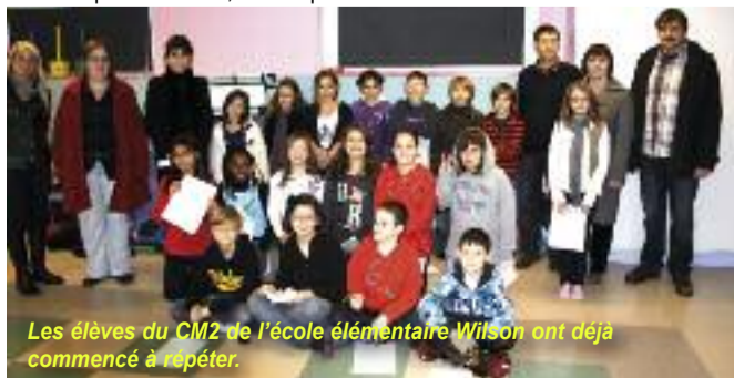
Les élèves du CM2 de l'école élémentaire Wilson ont déjà commencé à répéter.

Enfin le 13 mai 2012 une balade d'orientation pédestre et cycliste ponctuée d'énigmes et baptisée Trivial Poursuite , viendra remplacer le traditionnel rallye de l'environnement.