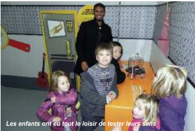
Les enfants ont eu tout le loisir de tester leurs sens