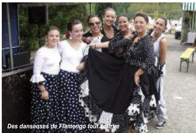
Des danseuses de Flamenco tout sourire

Au niveau folklore les danses et musiques du monde étaient à l'honneur, avec de la