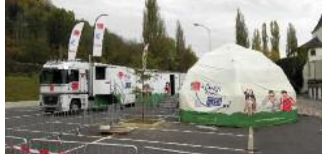
Le camion de la découverte de l'émission bien installé place François Mitterrand

Le succès «C'est pas Sorcier», cette animation a satisfait les organisateurs ravis de l'accueil et de l'affluence, la municipalité et les visiteurs. Assurément le rendez-vous est pris pour le nouveau thème qui sera proposé dans deux ans.