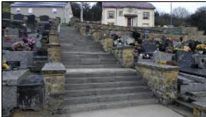
Le cimetière est toujours en travaux et fait parti des priorités de la municipalité. Après la réfection du mur d'enceinte, qui va se poursuivre, la pose de rampes et de rambardes et les diverses volées de marches, ce fut au tour des escaliers d'être rénovés par les agents communaux.