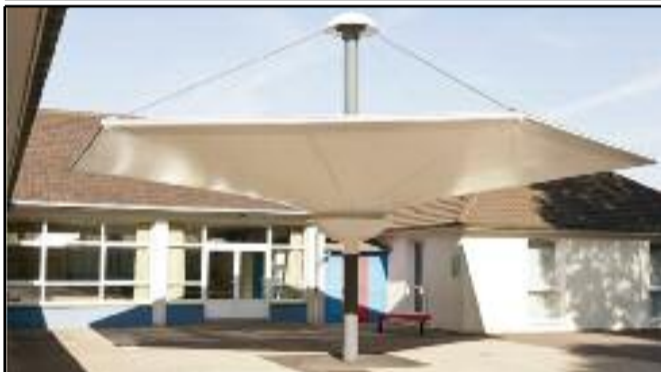
Depuis 2008, les écoles font partie des priorités de la municipalité. Les écoles élémentaires Wilson et Mairie ont bénéficié de nombreux et lourds investissements pour conforter les bâtiments. Ces travaux permettent d'offrir aux enfants, comme aux enseignants, les meilleures conditions de travail possibles avec en plus une trentaine de nouveaux ordinateurs répartis dans les 7 écoles de la ville. Cette année, la maternelle Wilson, verra ses portes et fenêtres remplacées et nous répondrons à une ancienne demande des enseignants de l'école du Batzenenthal, avec l'installation d'un préau, qui permettra aux enfants de sortir en récréation même par temps de pluie.