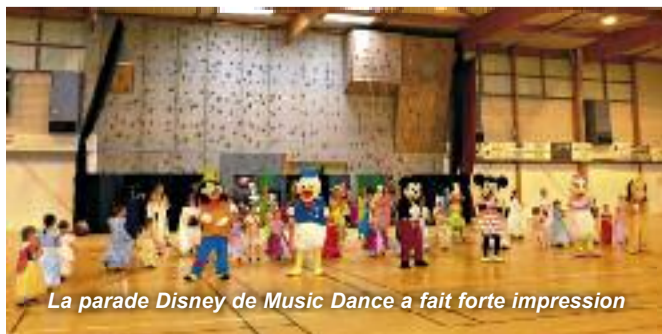
La parade Disney de Music Dance a fait forte impression