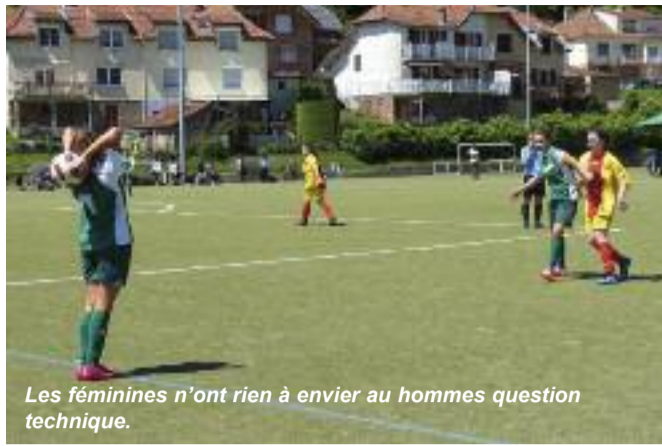
Les féminines n'ont rien à envier au hommes question technique.

Le 17 juin, le stade du Batzenthal a accueilli une "belle" compétition de football. "Belle" puisque, pour bousculer toutes les idées reçues, les matchs ont opposé des jeunes filles âgées de 12 à 18 ans. Le tournoi a été très disputé et les féminines, à l'image de l'équipe de France de football féminin, ont montré toute l'étendue de leurs talents tant techniques que tactiques, pour offrir un spectacle de grande qualité