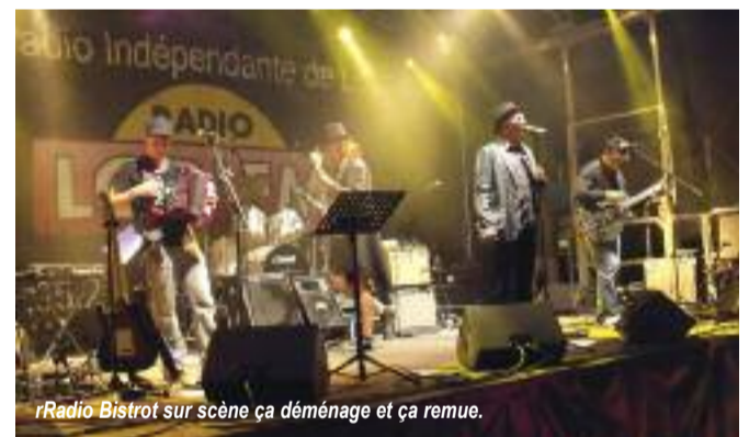
Radio Bistro sur scène ça déménage et ça remue.