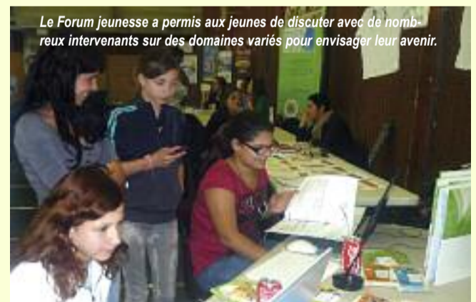
Le Forum jeunesse a permis aux jeunes de discuter avec de nombreux intervenants sur des domaines variés pour envisager leur avenir.

L'objectif du Forum Jeunesse était, dans une atmosphère festive, de donner aux jeunes des informations, voire des clefs qui leur permettraient d'aborder plus sereinement leur avenir. De nombreux partenaires institutionnels et associatifs sont venus répondre aux interrogations des adolescents. Ainsi, pour orienter les collégiens en fin de cycle, 4 établissements étaient représentés : Le lycée Saint André d'Ottange présentait ses sections optique et hôtellerie, les lycées professionnels Jean Macé de Fameck et Gaspard Monge de Hayange-Knutange détaillaient leurs cursus techniques et le lycée Saint Exupéry de Fameck était présent pour exposer son dispositif avec l'Institut d'Etudes Politiques de Paris, labellisé "Cordées de la Réussite" en 2008.