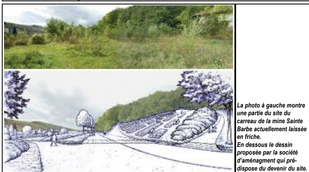
La photo à gauche montre une partie du site du carreau de la mine Sainte Barbe actuellement laissée en friche. En dessous le dessin proposé par la société d'aménagement qui pré-dispose du devenir du site.