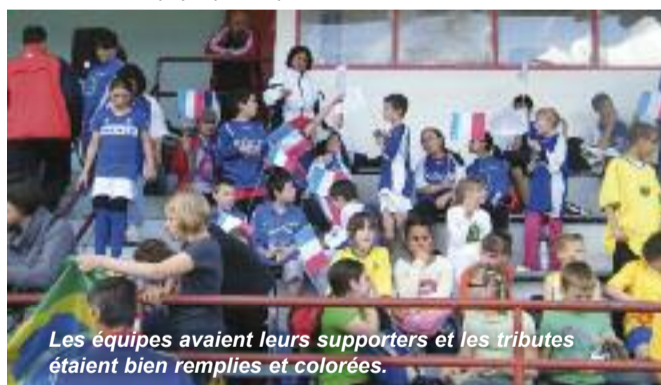
Les équipes avaient leurs supporters et les tribunes étaient bien remplies et colorées.

Vendredi 15 juin avec la collaboration de la ligue Lorraine de Football, l'USEP a organisé sa coupe du monde de football au stade du Batzenthal. Ce sont 420 élèves de 18 classes de CM1 et CM2 de tout le département qui sont venus avec les maillots et drapeaux, qu'ils avaient confectionnés, aux couleurs du pays qu'ils représentaient.