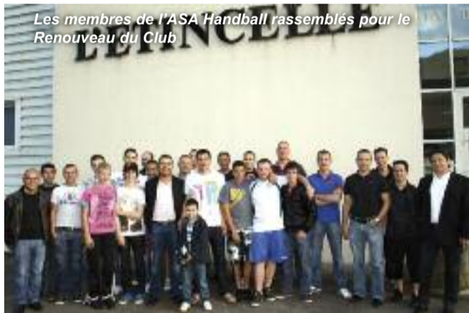
Les membres de l'ASA Handball rassemblés pour le Renouveau du Club

Ainsi l'ASA handball présentera, non seulement, une équipe 1ère au grand complet en championnat mais également une équipe B qui étoffera l'effectif du club avec un vivier de jeunes ainsi que des débutants qui