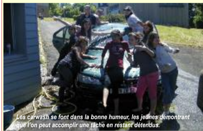
Les carwash se font dans la bonne humeur, les jeunes démontrant que l'on peut accomplir une tâche en restant détendus.

Les ados qui fréquentent notre local jeunes sont très impliqués et dynamiques. Non seulement, ils n'hésitent pas à se retrousser les manches pour mener à bien les actions menées par la structure, mais également pour financer leurs projets et se donner les moyens d'atteindre leurs objectifs. Comment gagner un peu d'argent quand on est jeune ? Les ados du local jeunes y répondent de plusieurs manières : Les chantiers projets pour la ville pour obtenir une aide municipale pour leurs sorties et actions ; ventes sur brocante, marché de Noël ou autre ; soirées à thèmes payantes ou encore de menus travaux tels que de l'ensachage et de l'emballage en supermarché rétribués par la générosité des clients ; ou encore des journées "Carwash" au cours desquelles les jeunes nettoient intérieur/extérieur les voitures des personnes inscrites. Les petites sommes ainsi