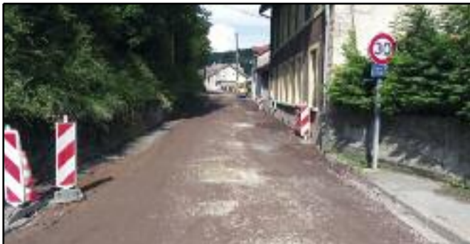
Après plusieurs mois de travaux, la réfection de la rue de Londres, pour un coût de l'ordre de 2,5 millions d'euros, se termine. Comme pour la rue de Verdun et la cité Sainte Barbe avant elle, la rue de Londres a bénéficié d'un lifting complet comprenant : la remise aux normes du réseau d'assainissement, le remplacement de la conduite principale d'eau potable, l'enfouissement de tous les réseaux secs : électricité, télécom etc. et le remplacement de l'ensemble de l'éclairage public, avec bien entendu une chaussée et des trottoirs flambant neufs. La municipalité entend poursuivre sa campagne de réhabilitation des cités minières et a déjà engagé les premières réflexions sur la rue Bompard.