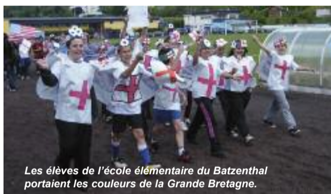
Les élèves de l'école élémentaire du Batzenthal portaient les couleurs de la Grande Bretagne.

Vendredi 15 juin avec la collaboration de la ligue Lorraine de Football, l'USEP a organisé sa coupe du monde de football au stade du Batzenthal. Ce sont 420 élèves de 18 classes de CM1 et CM2 de tout le département qui sont venus avec les maillots et drapeaux, qu'ils avaient confectionnés, aux couleurs du pays qu'ils représentaient.