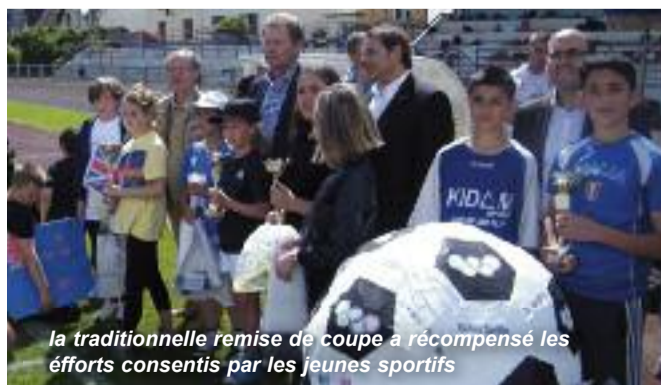
la traditionnelle remise de coupe a récompensé les efforts consentis par les jeunes sportifs

Entre le défilé des équipes et les tribunes bien garnies, la fête a battu son plein tant sportivement que festivement. La Suède, la Corée du Sud, le Brésil, l'Angleterre, l'Australie, le Japon, les Etats Unis, l'Afrique du Sud, l'Angleterre et la France, pour ne citer qu'eux, étaient représentés. Les élèves de l'école de la Mairie ont d'ailleurs brillamment porté les couleurs