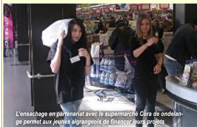
L'ensachage en partenariat avec le supermarché Cora de ondange permet aux jeunes algrangeois de financer leurs projets

Les ados qui fréquentent notre local jeunes sont très impliqués et dynamiques. Non seulement, ils n'hésitent pas à se retrousser les manches pour mener à bien les actions menées par la structure, mais également pour financer leurs projets et se donner les moyens d'atteindre leurs objectifs. Comment gagner un peu d'argent quand on est jeune ? Les ados du local jeunes y répondent de plusieurs manières : Les chantiers projets pour la ville pour obtenir une aide municipale pour leurs sorties et actions ; ventes sur brocante, marché de Noël ou autre ; soirées à thèmes payantes ou encore de menus travaux tels que de l'ensachage et de l'emballage en supermarché rétribués par la générosité des clients ; ou encore des journées "Carwash" au cours desquelles les jeunes nettoient intérieur/extérieur les voitures des personnes inscrites. Les petites sommes ainsi