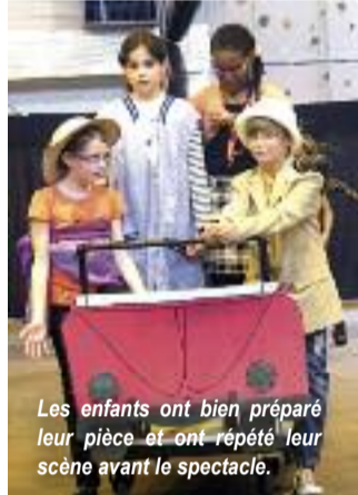
Les enfants ont bien préparé leur pièce et ont répété leur scène avant le spectacle.

En effet en marge du festival le 20 mars a eu lieu le "Tchat Forum" destiné aux collégiens en classe de 4 ème . Ce spectacle interactif, construit avec la compagnie de théâtre "Les uns et les Unes" en partenariat avec l'association "Les petits Débrouillards",