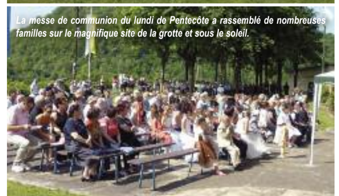
La messe de communion du lundi de Pentecôte a rassemblé de nombreuses familles sur le magnifique site de la grotte et sous le soleil.