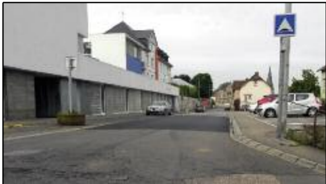
Après plusieurs reprises les riverains de la rue Marie Douchet ont fait part des excès de vitesse dans une rue pourtant très fréquentée et surtout avec la présence d'un établissement scolaire. Afin de répondre à ces problèmes 2 ralentisseurs ont été mis en place.