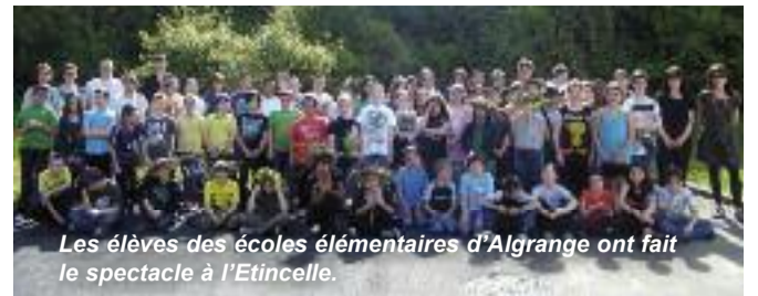
Les élèves des écoles élémentaires d'Algrange ont fait le spectacle à l'Étincelle.