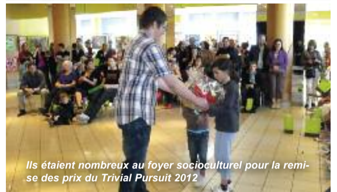
Ils étaient nombreux au foyer socioculturel pour la remise des prix du Trivial Pursuit 2012

a proposé des scénettes au cours desquelles les jeunes acteurs ont posé et solutionné des problématiques liées à l'environnement. De la même veine, le spectacle "Terre", a été interprété et mis en scène par les élèves de la commune. En effet, les enfants de CM2 de l'école de la Mairie, ont confectionné les décors alors que les CM2 de Wilson et du Batzenthal ont eux écrit les textes pour ensuite préparer puis interpréter les sketches