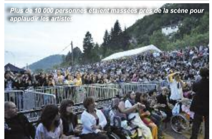
Plus de 10 000 personnes étaient massées près de la scène pour applaudir les artistes.