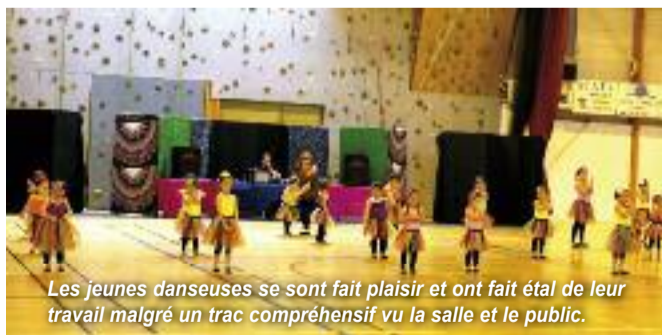
Les jeunes danseuses se sont fait plaisir et ont fait étal de leur travail malgré un trac compréhensif vu la salle et le public.

D'année en année, Music Dance peaufine ses chorégraphies et ses costumes, pour un résultat splendide. Le spectacle de l'association est toujours un enchantement. Bravo à tous les enfants et bénévoles !