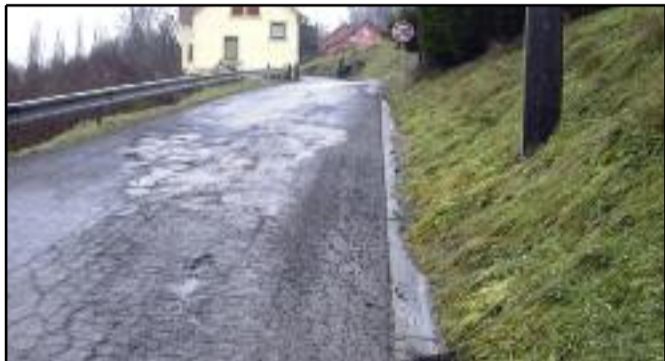
Les travaux de réfection de la route du Witten sont terminés et l'on peut apprécier sur les photos le travail réalisé et la qualité du revêtement. Après 40 ans d'attente, voici une promesse faite en 2008 par la municipalité et qui est tenue.