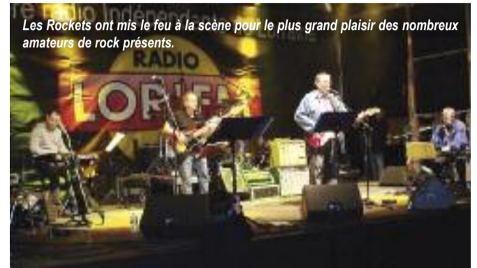
Les Rockets ont mis le feu à la scène pour le plus grand plaisir des nombreux amateurs de rock présents.

Ce fut une belle fête et une réussite pour la municipalité qui a toujours cru en ce grand projet de concert gratuit. Un grand merci à toute l'équipe de LOR'FM qui construit la partie musicale et promotionnelle et surtout aux bénévoles qui sont le cœur et l'âme de ce festival. Cette riche et belle aventure humaine et musicale va se poursuivre en 2013 pour notre plus grand plaisir.